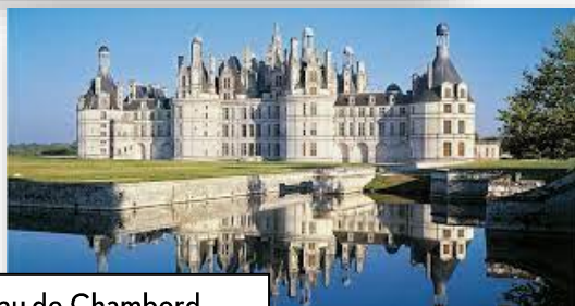
Château de Chambord